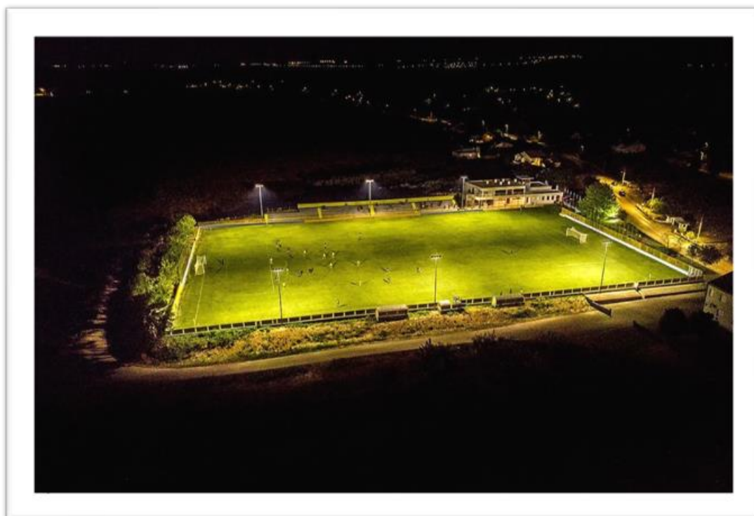
Slika 1. Nogometno igralište Bićina

Nogometni klub Polača nastupa na igralištu u Polači koje je s pratećim sadržajem jedno od najljepših u Dalmaciji.